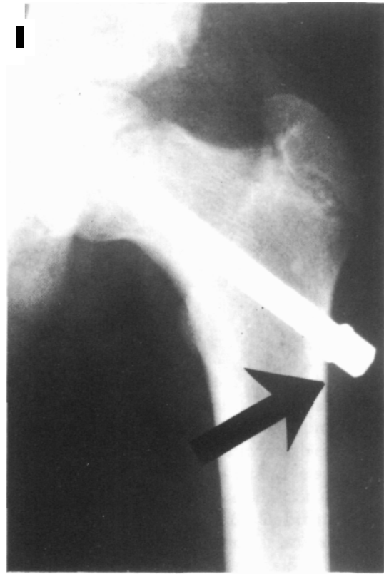
Fig. 4. El diseño de la cabeza impide la corticalización y permite el uso de un atornillador Allen o una llave exagonal.