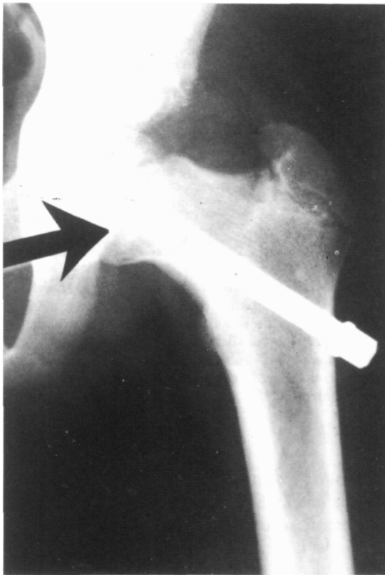
Fig. 3. El alma del tornillo es igual al diámetro externo de la rosca, para facilitar la extracción.

Presenta un diámetro intraóseo de 6,5 mm, que es igual al diámetro externo de la rosca. La rosca es de tipo esponjosa autorroscante con una longitud de 20 mm. Tiene una cabeza cilíndrica de 9,3 mm de diámetro y 10 mm de longitud, presentando un hexágono interno y otro externo que permite en for-