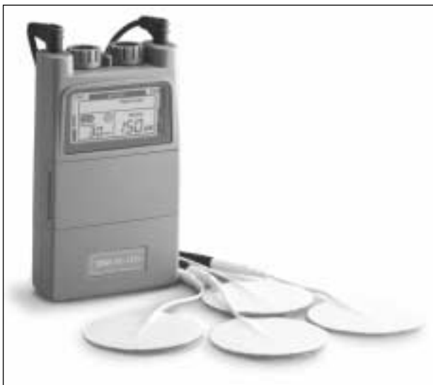
Figura 3. TENS (electroanalgesia).

Existen dos tipos básicos de corriente eléctrica: las llamadas unidireccionales (directa) en las cuales la corriente