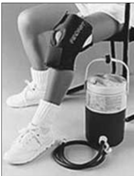
Figura 4. Dispositivo para la aplicación de crioterapia.

Cabe destacar que el efecto biológico principal de la crioterapia no es vascular sino metabólico, disminuyendo la actividad inflamatoria, como ya se mencionó.