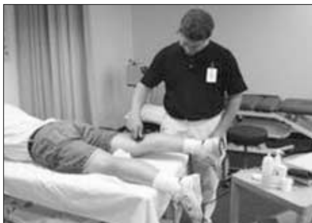
Figura 1. Aplicación de ultrasonidos.

En 1980, la FDA aprobó su uso para el tratamiento de sólo algunas condiciones puntuales (pseudoartrosis de tibia y artrodesis fallidas de columna).