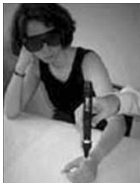
Figura 5. Aplicación de láser.