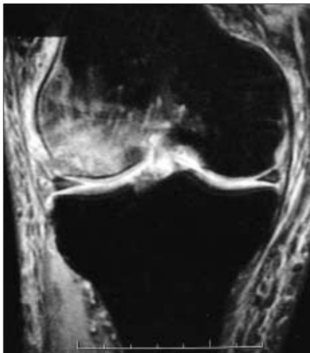
Figura 1. Osteonecrosis del cóndilo femoral interno.