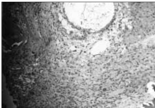
Figura 2. Estadios 1-2. Anatomía patológica. Zonas de sangrado y de edemas.

En el 98% de los casos el procedimiento resultó exitoso con respecto al dolor; en este sentido ese porcentaje es menor que el que se observa con la evoluci3n natural de la enfermedad.