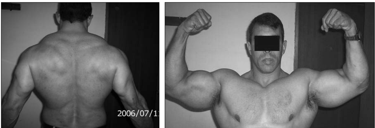
Figura 3. Movilidad posquirúrgica.

del tendón con un pequeño fragmento óseo. También está relacionada con la osteodistrofia renal 1,4,8 y con enfermedades como artritis reumatoide, 10,11 lupus eritematoso sistémico, 8,10,11 hiperparatiroidismo, 8,10,11 xantomas, 10,11 hemangioendoteliomas, 10,11 osteogénesis imperfecta tardía, 6,8 síndrome de Marfan 6,8 y diabetes, así como con infiltraciones con corticoides por bursitis olecraniana 8 y consumo de esteroides por vía oral o su inyección intramuscular. 10,11