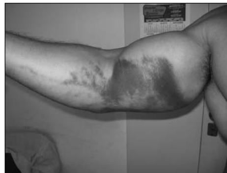
Figura 1. Aspecto preoperatorio. Hematoma y edema importantes.