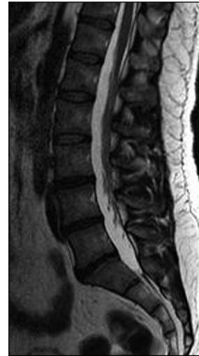
Figura 1. Enfermedad degenerativa discal lumbar L3-L4, L4-L5 y L5-S1.

En este caso en particular, el diámetro desde el ángulo posterolateral derecho hasta el ángulo anterolateral izquierdo donde se produjo la lesión era de 33,6 mm, y el ángulo subaórtico era de 52°, es decir 5,48° menos del promedio encontrado en los trabajos anatómicos cadavéricos. Además, la bifurcación se encontraba a nivel del disco de L3, lo cual se presenta sólo en el 11,36% de los casos. 7 Al observar estas mediciones concluimos que los