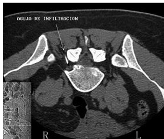
Figura 3. Bloqueo radicular L5 derecho.