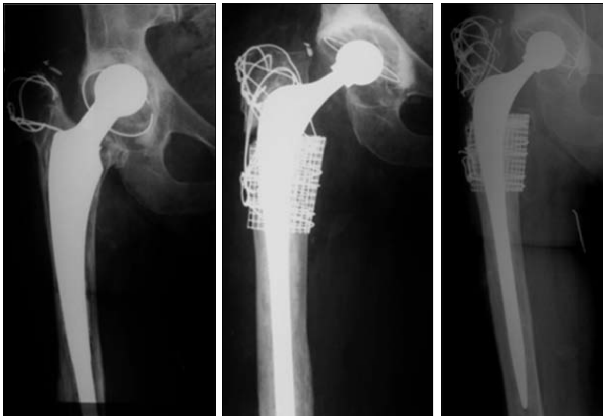
Figura 1. A. Paciente operado en otro centro con un tallo femoral no cementado. Nótese el escaso capital óseo, el grosor de las corticales, el hundimiento del tallo y el aflojamiento del cótilo. B. Posoperatorio inmediato por vía transtrocanterea. Se utilizó un tallo largo, injerto óseo y malla cribada. C. A los 7 años de la operación se observa la incorporación del injerto y el consecuente cambio en la calidad ósea.

En el examen radiográfico preoperatorio se analizaron los diferentes tipos de fémures según la clasificación de Dorr; si bien esta clasificación fue ideada originalmente para describir fémures vírgenes, en este caso la utilizamos para representar gráficamente el tipo de fémur por revisar teniendo en cuenta su relación corticomédular. En cuanto al análisis de la pérdida de capital óseo, se utilizó el sistema de la Endo-Klinik (Tabla 1). En el análisis posoperatorio se observó el comportamiento de los diferentes tallos, para lo cual se midió su hundimiento, la integración del injerto de acuerdo con la remodelación y mejora de la calidad de las corticales, y la presencia de demarcación o signos de aflojamiento, mientras que para el examen clínico se utilizó el puntaje de cadera de Harris.