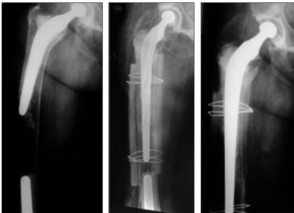
Figura 2. A. Paciente con un aflojamiento mecánico del tallo de tipo Charnley, Óbsérvese su hundimiento y varización (presenta también un remplazo total de rodilla con vástago femoral). B. Posoperatorio inmediato donde, además del injerto molido, se utilizaron dos tablas corticales como refuerzo. C. A los 2 años el tallo conserva su posición, el injerto molido se encuentra integrado, mientras que las tablas corticales se hallan parcialmente reabsorbidas.

En los 6 casos en que se revisó el componente acetabular junto con la utilización de aloinjerto molido e impactado, se observó la correcta integración y remodelación de este.