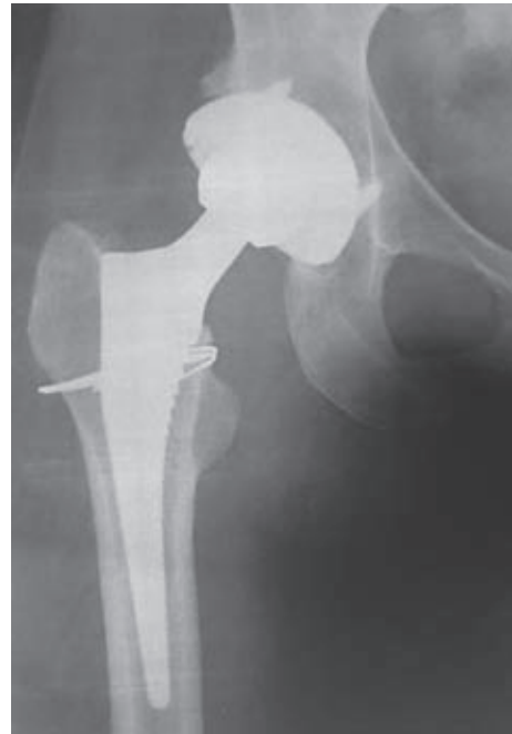
Figura 1. Tratamiento de fractura periprotésica de tipo A2 con lazada de alambre y tallo femoral estable a los dos años de la cirugía.

La evolución de las fracturas fue buena en 27 (96,4%) casos, con consolidación, sin ningún cambio en el posicionamiento del tallo femoral.