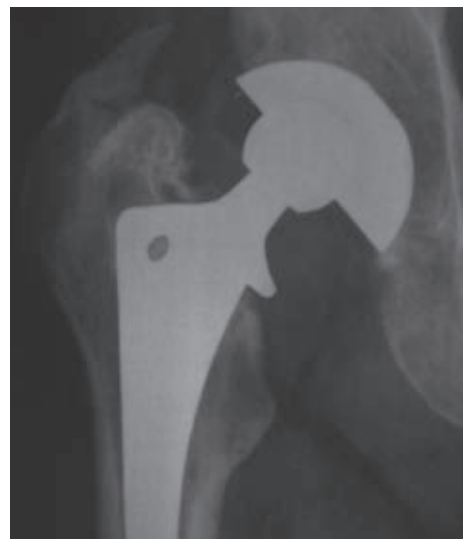
Figura 3. Calcificación heterotópica grado II de Brooker.

La mayoría de las caderas eran comparativamente más valgus que aquellas sin esta complicación, con un ángulo cervicodiafisario promedio de 140° (rango de 120° a 160°). Mallory 14 correlacionó esto con la predisposición que genera realizar un punto de entrada femoral erróneo y, por ende, transferir fuerzas de forma incorrecta durante la preparación del canal femoral. Creemos que, al estar