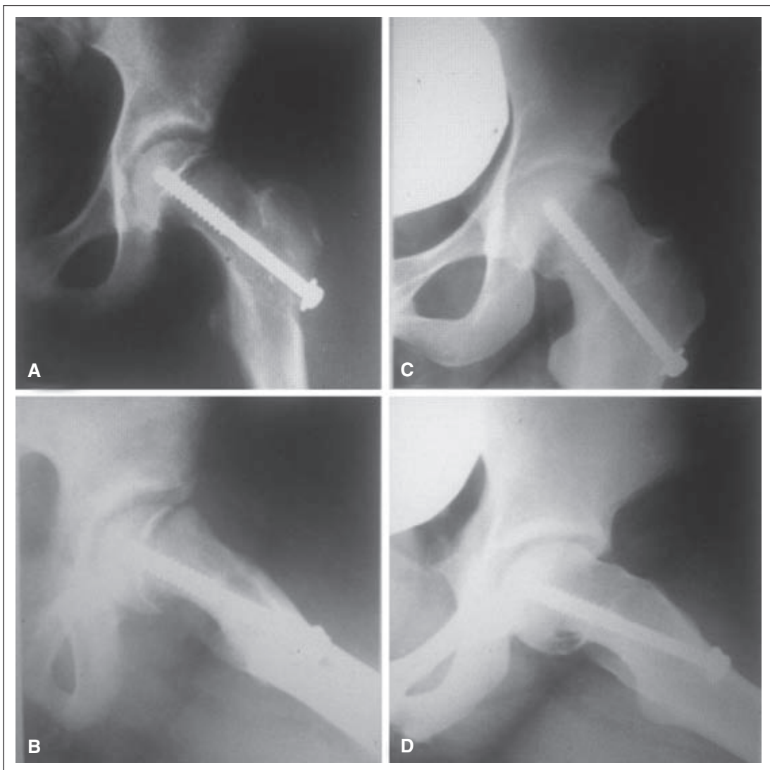
Figura 2. A y B. Radiografías de frente y de perfil, posoperatorio inmediato de un deslizamiento de 40^\circ fijado in situ. C y D. Radiografías del mismo paciente a los 65 meses de seguimiento. Se observa un ángulo de Southwick de 28^\circ en el perfil. La remodelación estuvo presente en 12^\circ . En las radiografías A y B, el grado de Tonnis es 1 y, en las radiografías C y D, es de 2, por lo que también hubo deterioro.

Se sabe que incluso los deslizamientos leves pueden tener consecuencias a largo plazo, por defectos mecánicos en la articulación de la cadera, y que la gravedad del deslizamiento influye en los malos resultados. 5-13,17 El daño temprano ocasionado por el choque entre la prominencia de la metáfisis femoral deformada y el cartílago articular del acetábulo es una realidad confirmada por varios trabajos. 18-22 Sin embargo, la fijación in situ de los deslizamientos >30^\circ sigue siendo el método preferido por la ma-