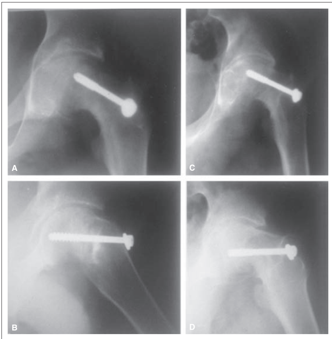
Figura 3. A y B. Radiografías de frente y de perfil, posoperatorio inmediato de un deslizamiento crónico grave fijado in situ. C y D. Radiografías del mismo paciente a los 48 meses de seguimiento. Se observa un rápido deterioro radiográfico. En las radiografías A y B, el grado de Tonnis es 2 y, en las radiografías C y D, 3 con pseudoquistes epifisarios, deformidad y pinzamiento grave. El paciente tuvo una condrólisis como complicación.