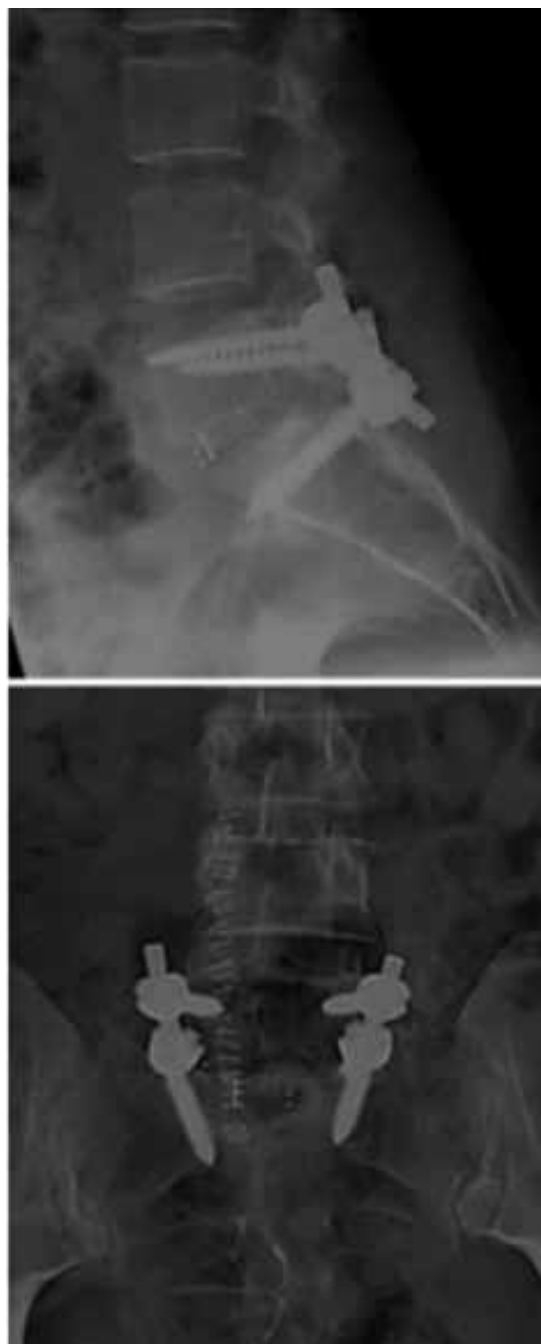
▲ Figura 2. Control radiológico posquirúrgico.

La luxación unilateral lumbosacra es una lesión rara que se produce por un mecanismo de alta energía. El diagnóstico se basa en una adecuada exploración física y la evaluación de estudios por imágenes (radiografías, tomografía y resonancia). Actualmente, el tratamiento de elección consiste en la reducción abierta, facetectomías, descompresión y fijación circunferencial con caja intersomática y tornillos pediculares, con el objetivo de mantener la estabilidad con la restauración de la alineación y la descompresión de los elementos neurales.