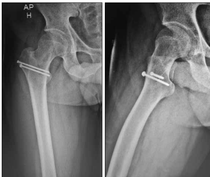
▲ Figura 7. Radiografías de control a los tres meses de la cirugía.

Se han publicado múltiples abordajes para extraer los proyectiles o sus fragmentos retenidos en la articulación de la cadera. 3,4 Los métodos artroscópicos se encuentran