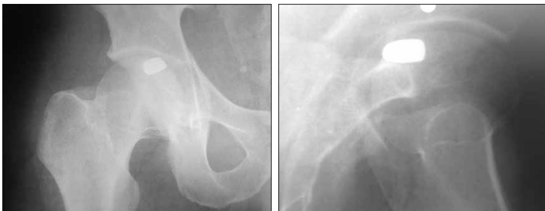
▲ Figura 1. Radiografías de frente y de perfil de cadera izquierda. Se observa un proyectil en la cabeza femoral.

La indicación fue la extracción del proyectil mediante una luxación anterior a través de un abordaje posterolateral asociado a una osteotomía trocantérica, según la descripción de Ganz. 6 De esta forma, se logró visualizar el proyectil impactado en la cabeza femoral (Figura 3). Una vez extraído el proyectil se realizaron microperforaciones en el fondo de la lesión, la cual fue rellenada con injerto óseo obtenido del trocánter mayor. Se efectuó un exhaustivo lavado de la articulación con solución fisiológica. La