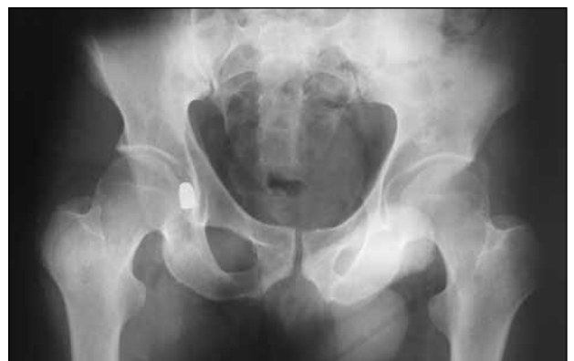
▲ Figura 5. Radiografía de ambas caderas, de frente. Obsérvese el proyectil en la cadera derecha.