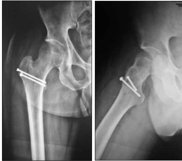
▲ Figura 8. Radiografías a los 30 meses. Consolidación de la osteotomía.

muchas veces limitados por la localización de los proyectiles o por la presencia de fracturas de la cabeza femoral o el acetábulo, que requieren una reducción abierta. 3-5 En nuestros dos casos, optamos por abordajes formales de cadera asociados a una luxación anterior que favorezcan la visualización completa de la cabeza femoral y, a su vez, un acceso al acetábulo que brinde la posibilidad, en ambos casos, de realizar maniobras, como microperforaciones, en las lesiones osteocondrales producidas por el proyectil.