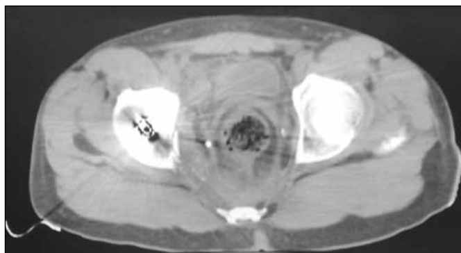
▲ Figura 2. Tomografía computarizada de cadera.