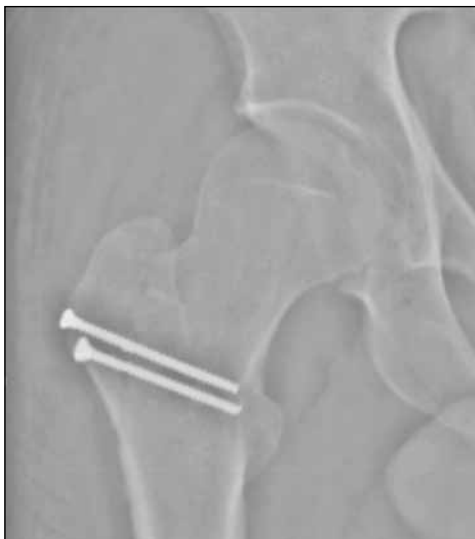
▲ Figura 4. Radiografía a los 36 meses.

La indicación quirúrgica, como en el caso anterior, fue la extracción del proyectil mediante un abordaje postero-lateral asociado a una osteotomía trocantérica, como la descrita por Ganz, 6 para lograr una óptima visualización